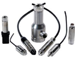
0.1%の精度範囲の UNIK 5000 センサ