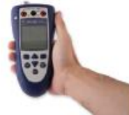
プロセス産業テストツール